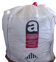
Big-bag spécifique amiante

Les déchets livrés en vrac seront refusés