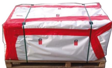
Exemple de palette filmée

N'introduisez pas de déchets autres que les déchets d'amiante-ciment