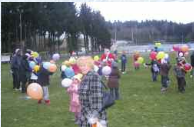
Lâcher de ballons avec le Père Noël organisé par le CMJ

A 16 heures, le Père Noël a fait son apparition pour la grande joie des petits.