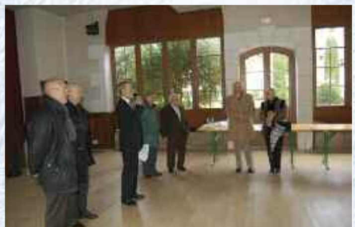
Distinction commémorative pour les anciens combattants de 39-45